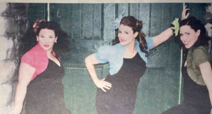
Les Chiclettes débloquent dans la région pour présenter le nouvel album.