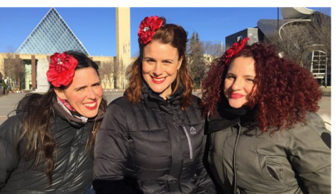
Les Chiclettes en Alberta.